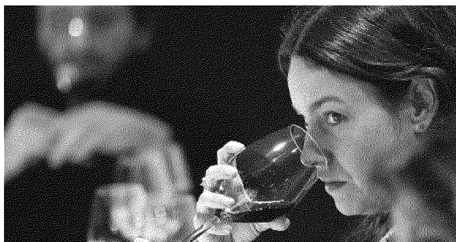
La 'capitale' di produzione del Chianti, ovvero la Montespertoli, arriverà fino a 160mila ettolitri di vino

I numeri di Chianti Lovers 2017: 100 aziende presenti, 500 le etichette presentate 3000 ed oltre i visitatori attesi, 800mila gli ettolitri prodotti di Chianti (160.000 nella sola Montespertoli), 100 euro il costo a ettolitro